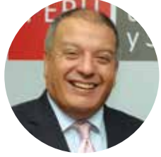
MILTON VON HESSE EX MINISTRO DE VIVIENDA, CONSTRUCCIÓN Y SANEAMIENTO

FORO POLÍTICAS PÚBLICAS: TRANSPORTE, VIVIENDA, CONSTRUCCIÓN Y SANEAMIENTO