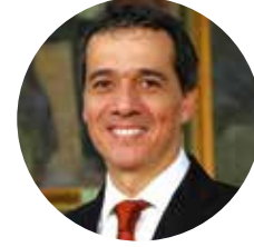
ALONSO SEGURA EX MINISTRO DE ECONOMÍA Y FINANZAS

FORO CLIMA DE INVERSIÓN, MERCADOS Y PRECIOS